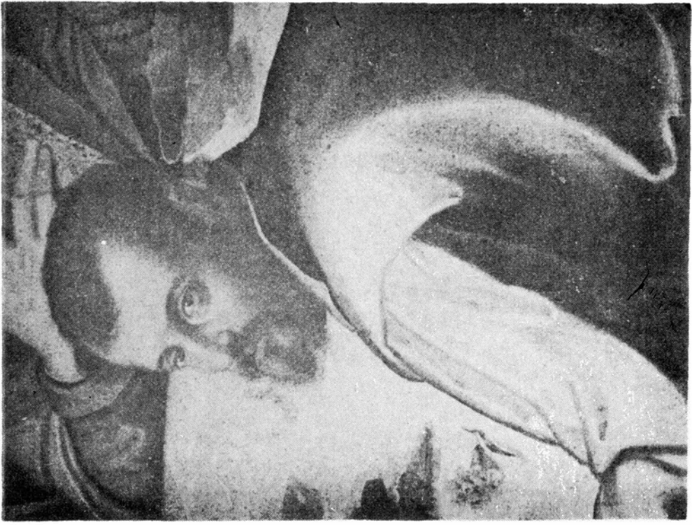
Figura 3. La Última Cena . Detalle. El deseo de individualizar, de señalar los rasgos personales es más que manifiesto. Estamos ante un auténtico autorretrato.