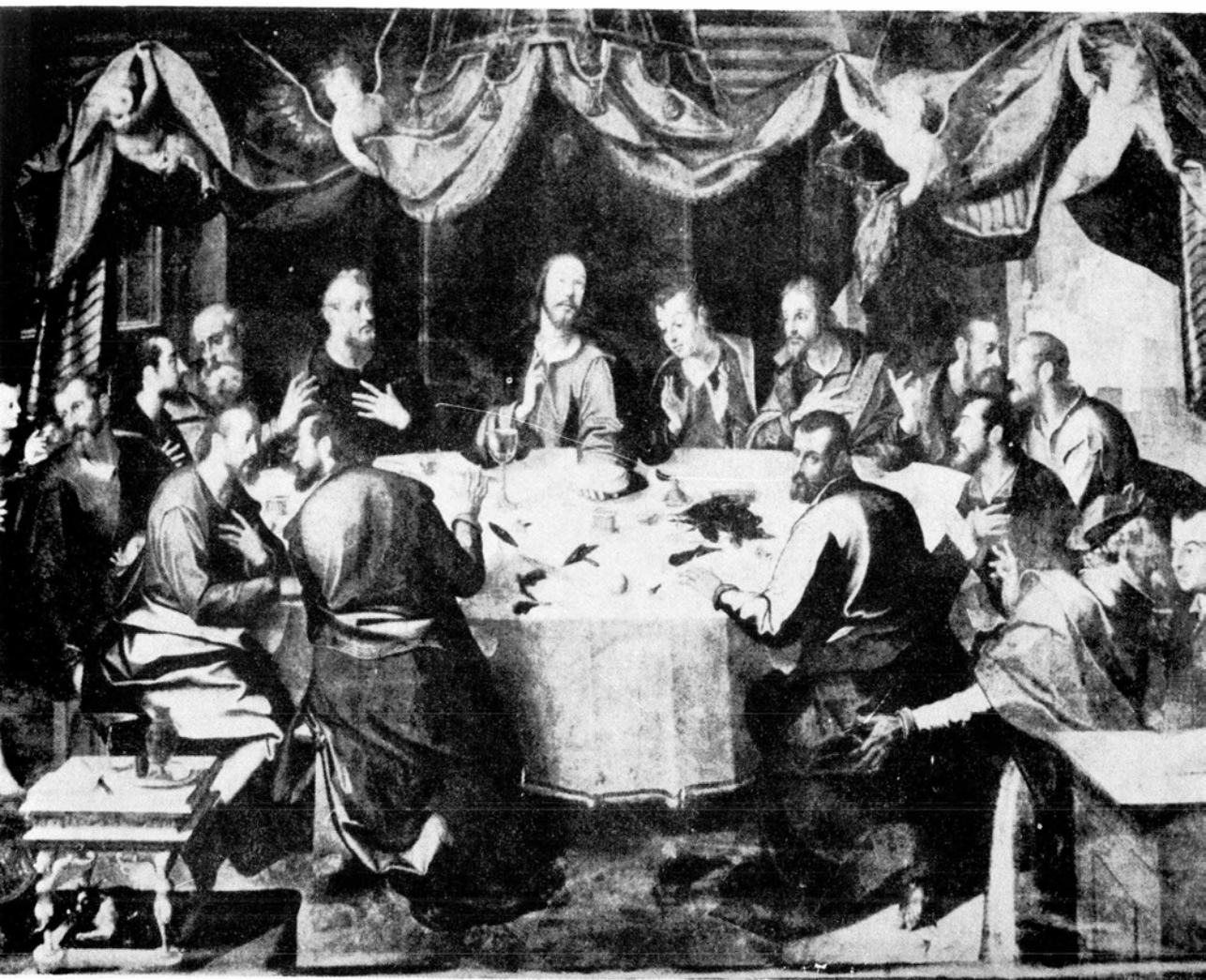
Figura 1. Baltasar de Echave Orio. La Última Cena .

Iglesia del Convento franciscano de San Antonio. Texcoco, Méx. Obsérvense detenidamente los rostros de cada uno de los personajes y compárense con los de las obras firmadas por Echave Orio; se caerá en la cuenta que la atribución a ese pintor es incontestable.