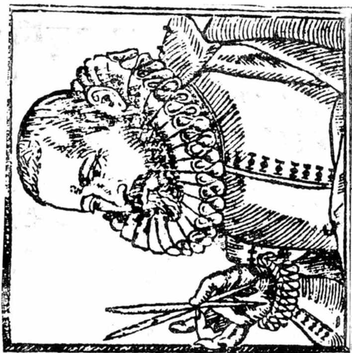
Figura 6. Detalle del anterior. Echave Orió, vestido a la usanza de la época, sostiene entre sus manos la pluma de escritor y el pincel de pintor, para dar a entender el cultivo que dedicaba a ambas partes.