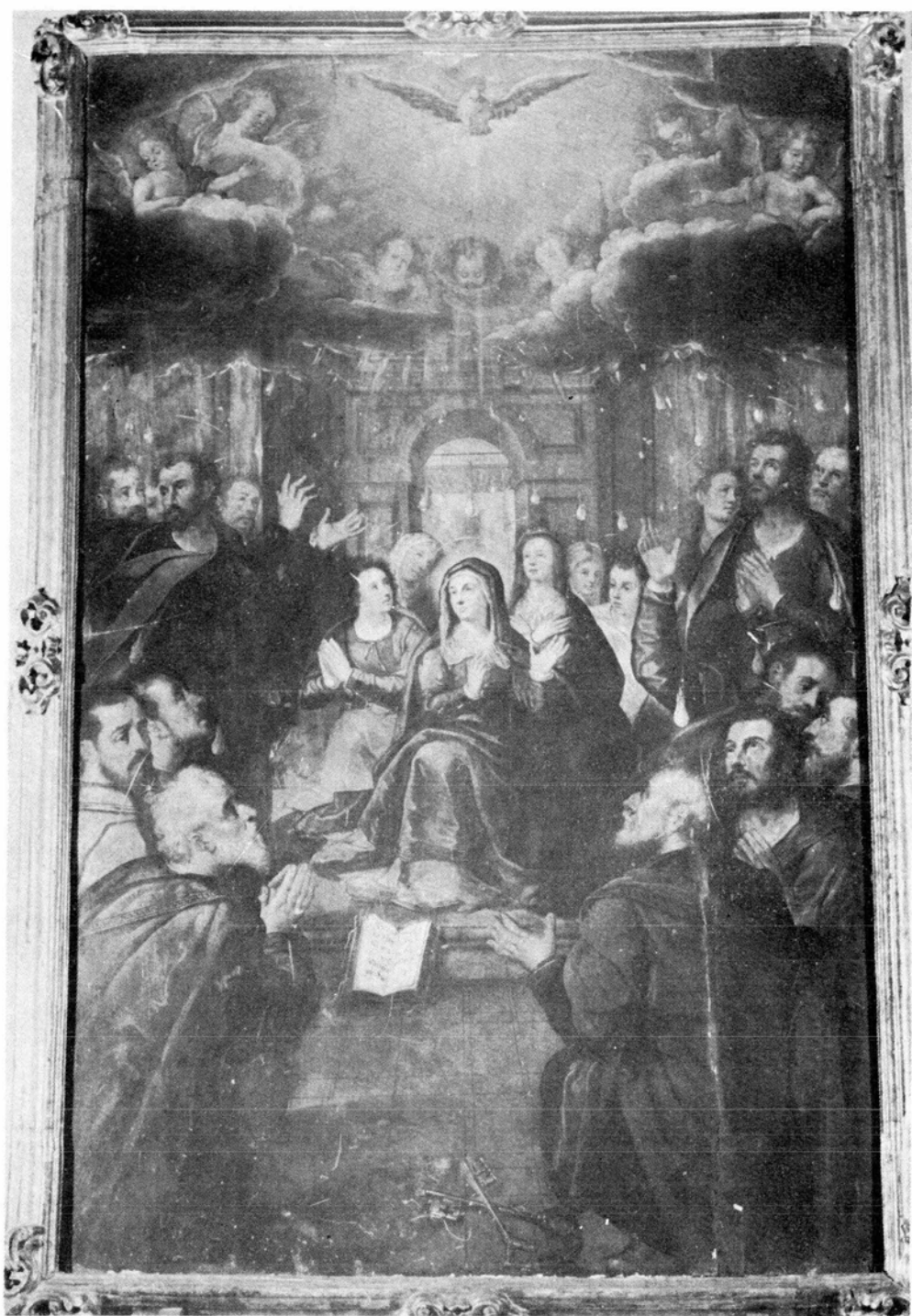
Figura 2. Baltasar de Echave Orio. El Pentecostés . Iglesia de la Profesa, México, D. F. La segunda figura del ángulo inferior izquierdo es la que tradicionalmente se ha considerado como autorretrato del pintor.